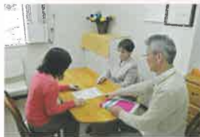
◀ 相談室 個室でゆっくりと ご相談頂けます。

相談支援事業所 ひかりの森 (相談専用) TEL/FAX 048-967-5050